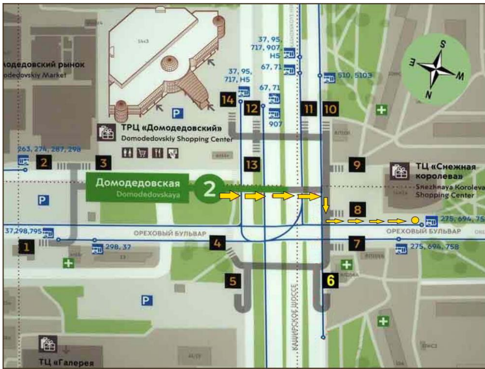
Рисунок 1. Место встречи участников Презентации для трансфера в Музей заповедник «Горки-Ленинские»