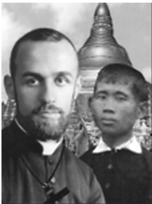
Священник Марио Вергара и катехизатор Исидоро Нгей Ко Лат

В юбилейный год 500-летия католицизма в Бирме/Мьянме произошло важнейшее для католиков страны событие. 27 мая 2014 г. в итальянском городе Аверса были причислены к лику блаженных (беатифицированы) священник Папского института зарубежных миссий итальянец отец Марио Вергара (1910–1950) и его катехизатор 14 бирманец Исидоро Нгей Ко Лат (1918–1950), убитые религиозными фанатиками в Мьянме 24 мая 1950 г. Таким образом впервые в истории к лику блаженных был причислен католик из Бирмы/Мьянмы. Папа Римский Франциск уполномочил Конгрегацию по канонизации святых опубликовать указ о признании мученической смерти миссионеров. «Пусть их героическая верность Христу станет стимулом и примером для миссионеров, особенно катехизаторов в новых землях, которые выполняют важную и незаменимую апостольскую миссию, и за этот труд им благодарна вся Церковь,» – сказал Папа Франциск во время своего выступления 21 мая 2014 г. 15