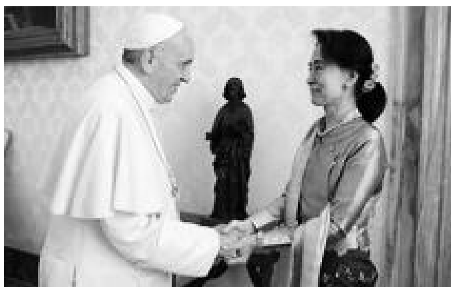
Папа Римский Франциск и Аун Сан Су Чжи . Ватикан. 28 октября 2013 г.

Папа Франциск хорошо осведомлен о ситуации в Мьянме. В октябре 2013 г. лидер оппозиции лауреат Нобелевской премии мира Аун Сан Су Чжи 12 во время ее турне по странам Европы посетила Рим, где была избрана почетным гражданином города. Встреча с Папой состоялась в Папской библиотеке Ватикана. Папа Франциск выразил свою признательность бирманскому политику за ее «приверженность ненасильственному продвижению демократии в ее стране» и предложил свою поддержку. Понтифик сообщил, что он молился за Мьянму и за успешность межрелигиозного диалога в этой стране. Во время брифинга для журналистов глава пресс-центра Святого Престола Федерико Ломбарди сказал, что в беседе «проявилось большое созвучие и совпадение во взглядах и мнениях между Папой Римским и его гостьей, которая олицетворяла собой всю Азию». Среди тем, затронутых во время встречи, были вопросы, касающиеся культуры и межрелигиозных отношений. Отец