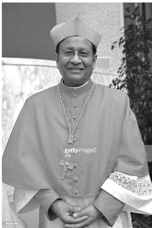
Первый в истории бирманский кардинал. Ватикан, 14 февраля 2015 г.

В своей проповеди в феврале 2015 г. кардинал Чарльз Маун Бо осудил религиозный экстремизм в стране. Он выразил опасение, что радикальный настрой некоторых буддистов по отношению к мусульманам может подорвать демократические процессы в обществе. Чарльз Маун Бо призвал всех религиозных лидеров страны содействовать снижению социальной