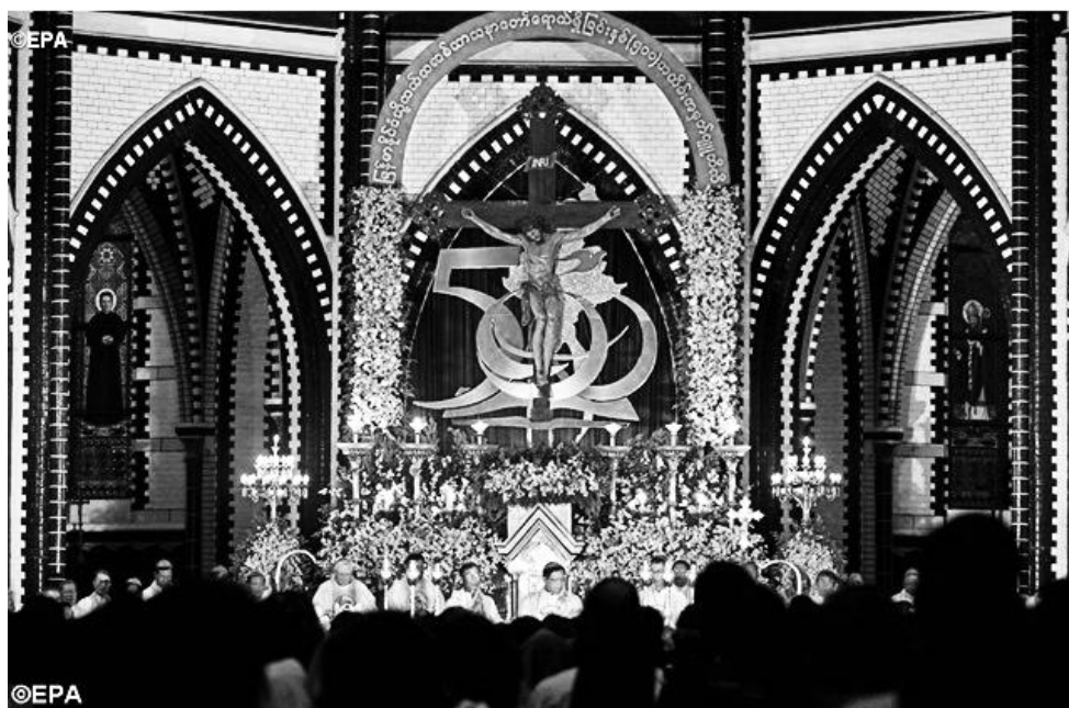
Заключительные торжества по поводу 500-летия Римско-католической церкви в Мьянме в кафедральном соборе Пресвятой Девы Марии в Янгоне. 21 ноября 2014 г.

тить эту дату, так как находившийся у власти военный режим несколько десятилетий проводил репрессивную политику в отношении религиозных меньшинств, продвигая буддизм в качестве инструмента национальной идентичности. После передачи власти гражданской администрации и начала проведения в стране демократических реформ руководство католической церкви приняло решение отметить эту знаменательную дату в 2013–2014 гг. Но в декабре 2011 г., уже при номинально гражданском правительстве, католики Мьянмы отметили 100-летие кафедрального собора Пресвятой Девы Марии в Янгоне. Соответствующие торжества прошли 8 декабря 2011 г. в праздник Непорочного Зачатия Пресвятой Девы Марии. Специальным папским представителем на торжествах был кардинал Ренато Раффаэле Мартино. Папа Римский Бенедикт XVI поручил ему в верительном послании «призвать католиков Мьянмы к постоянному возрастанию веры и любви к Христу и Евангелию», а также передать поздравления светским властям, религиозным лидерам буддистов и всем, кто уважает миссию церкви и права человеческой личности 9 .