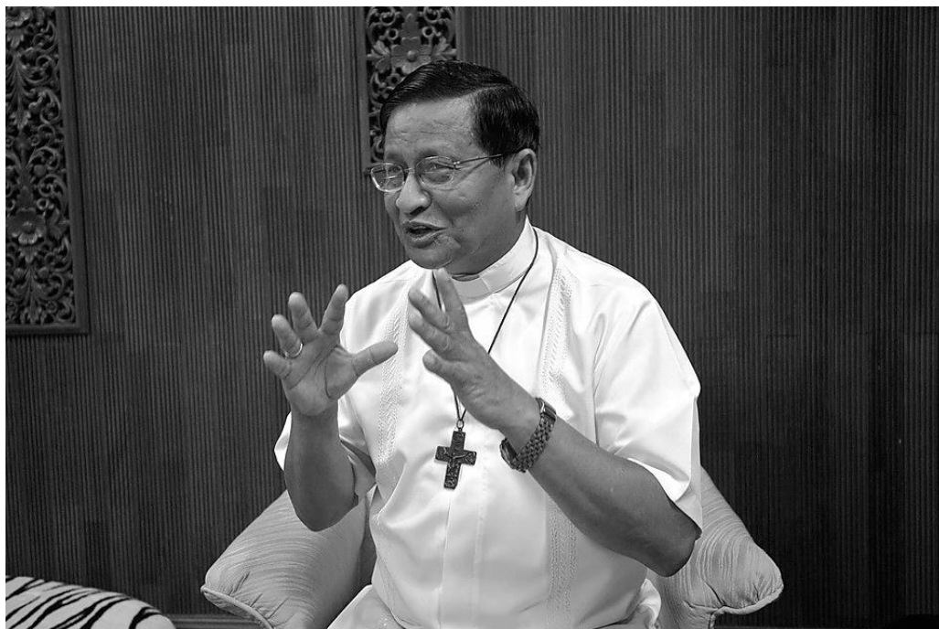
Недавно назначенный кардинал Чарльз Маун Бо во время интервью. Янгон, 6 января 2015 г.

Кардинал Чарльз Маун Бо сказал, что «благодаря действиям Папы, мир узнал о Мьянме», и что он «счастлив стать представителем своей страны в Ватикане», «теперь мой голос будет лучше услышан и правительством, и народом, и международным сообществом» 22 . Назначение архиепископа из Янгона кардиналом произошло в сложное для Мьянмы время. С передачей власти номинально гражданскому правительству, ослаблением военного контроля над населением и началом реформ страна столкнулась с обострением религиозной нетерпимости и в частности, буддистского большинства против мусульманского меньшинства. Продолжающиеся военные столкновения в штате Качин, в котором преобладает христианское население, превратили этот регион в последние три года в самую «горячую точку» страны, хотя в этом случае религия не главная причина конфликта.