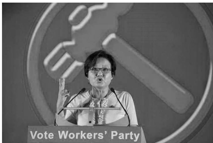
Председатель Рабочей партии Сильвия Лим