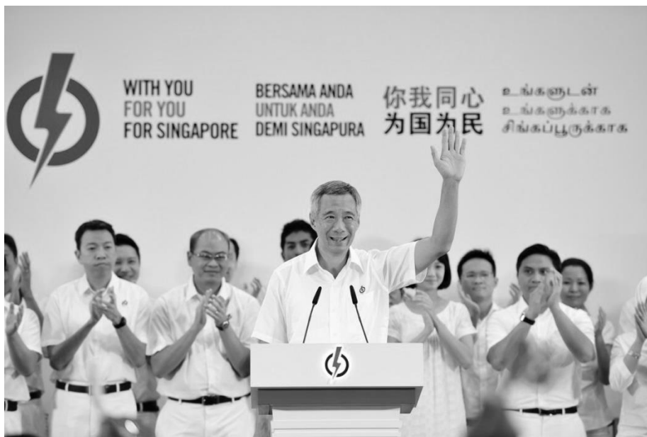
Предвыборный митинг ПНД. На трибуне – председатель ПНД, премьер-министр Сингапура Ли Сянь Лун

По мнению доктора Вальтера Тэсейра из сингапурского института UniSim, одной из причин падения популярности оппозиционных партий стало, как ни парадоксально, активное развитие социальных сетей. Оппозиция уже не может оправдать свое существование, просто утверждая, что она - «глас народа», поскольку сегодня депутаты ПНД и министры круглосуточно доступны на своих страницах в Facebook. В последние годы блогеры и разного рода гражданские активисты практически полностью вытеснили представителей оппозиции в деле постановки перед правительством острых вопросов 20 , и оно не оставляет их без внимания.