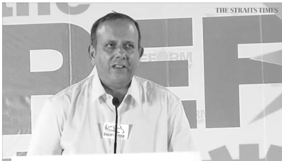
Генеральный секретарь Партии реформ Кеннет Джеяретнам.

ловины прибыли от инвестирования резервов ‡ . «Они [правительство ПНД] скажут вам, что наши планы не сработают, потому что нам нечем платить за них. Это неправда», - сказал он.