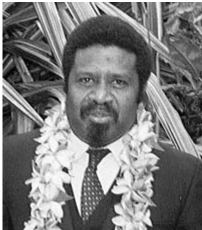
Святой отец Уолтер Лини, первый премьер-министр Вануату