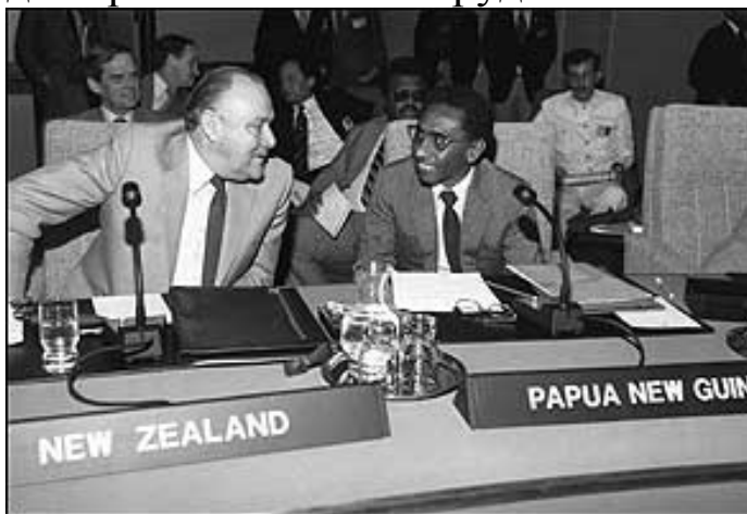
Премьер-министр Новой Зеландии Роберт Малдун и премьер-министр ПНГ Джулиус Чэнь, 1980

В итоге У. Лини (как он того и опасался) не получил никакой помощи от бывших метрополий, кроме устных заверений, что ситуация вскоре нормализуется. Впрочем, как показало время, первому в истории Вануату премьер-министру удалось достойно выйти из сложившейся ситуации и даже наладить региональное сотрудничество между странами Океании.