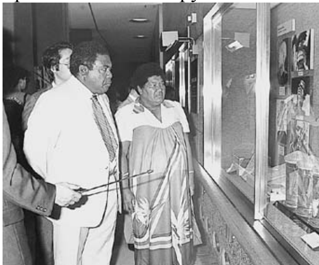
Первый президент Вануату Джордж Сокоману (слева) с женой (справа), Порт-Вила, 1980

ства – Республики Вануату по улицам столицы Порт-Вилы прошагали 300 вооруженных бойцов новогвинейской армии.