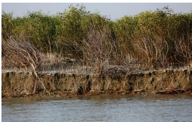
Структура почвы острова Башан Чар

Впервые идея переселения беженцев из Мьянмы на остров возникла еще в 2015 г., когда в лагерях жили около 400 тысяч человек, бежавших из соседней страны в предыдущие годы, однако после резкой критики со стороны правозащитников от этих планов отка-