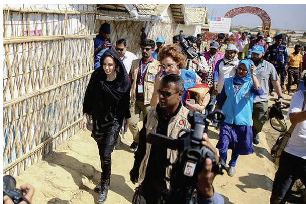
Посол доброй воли УВКБ Анджелина Джולי в лагере беженцев Кутупалонг. Февраль 2019

финансовую поддержку, чтобы оказать помощь жителям этих поселений 6 . В мае 2018 г. лагерь беженцев в Кокс-Базаре посетила другая известная киноактриса Приянка Чопра в качестве представителя ЮНИСЕФ.