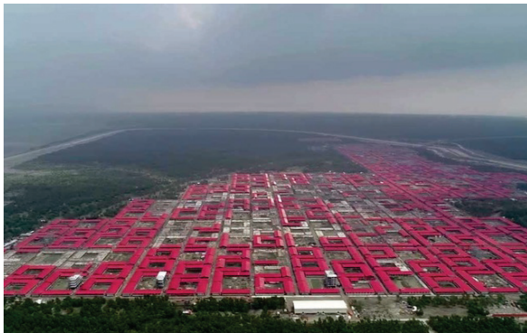
Лагерь для переселенцев на о. Башан Чар

Переселенцам будет доступна квалифицированная медицинская помощь, их дети получают возможность учиться, для верующих обустроены молельные помещения. На острове построены две вертолетные площадки. Разработана система глубокого бурения и водяных насосов для снабжения пресной водой. Привезенные туда заранее специалисты занимаются разведением пресноводной рыбы и животноводством в ожидании переселенцев. Для связи с материком и доставки грузов у острова будут постоянно находиться два больших корабля и 20 быстроходных моторных лодок 7 .