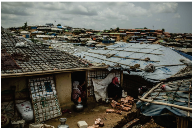
Лагерь для беженцев.

территории крупнейшего в мире лагеря беженцев Кутупалонг-Балукхали в округе Кокс-Базар, где уже жили рохинджа, бежавшие из Мьянмы в предыдущие годы. Гигантское поселение территориально разделено на 22 лагеря.