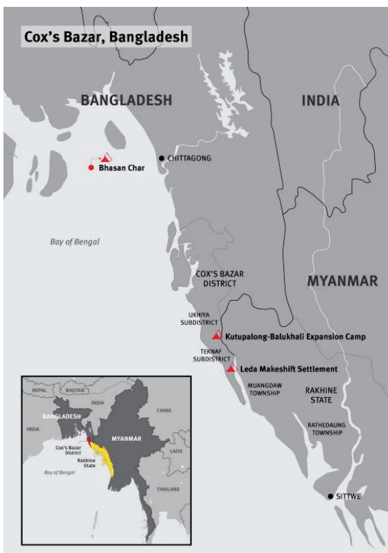
Остров Башан Чар (Bhasan Char) в Бенгальском заливе

Ранее она совершила множество поездок в лагерь беженцев в Ираке, Турции, Ливане, Мальте, Иордании, Сирии и других странах и, как никто другой, знает о реальном положении в подобных местах. Беженцам нужна помощь, и посланница ООН своими поездками старается привлечь не только внимание мировой общественности к кризису, но и