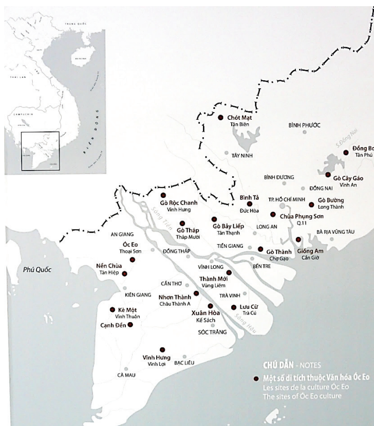
Карта 1. Памятники культуры Окео в Южном Вьетнаме. Map 1: Sites of the Oc Eo Culture in Southern Vietnam.

Археологические памятники дельты Меконга включают в себя городище Окео и свыше 90 памятников «культуры Окео» I–VII вв. на территории Вьетнама (см. карту 1 ), из них раскопано свыше двадцати, а также Ангкор Борей в Камбодже (Vo Si Khai 2003: 46, 39; Stark 2006b: 149). К ним нужно прибавить систему древних каналов, общая длина которых составляет свыше 200 км. Эпохе «культуры Окео» предшествовал период раннего железного века, на протяжении которого формировалась иерархия или гетерархия поселений и складывались сложные политические системы типа вождеств (Higham 2002: 168–227). В данной статье дается обзор основных археологических находок, сделанных в дельте Меконга, на территории нынешних Камбоджи и Вьетнама.