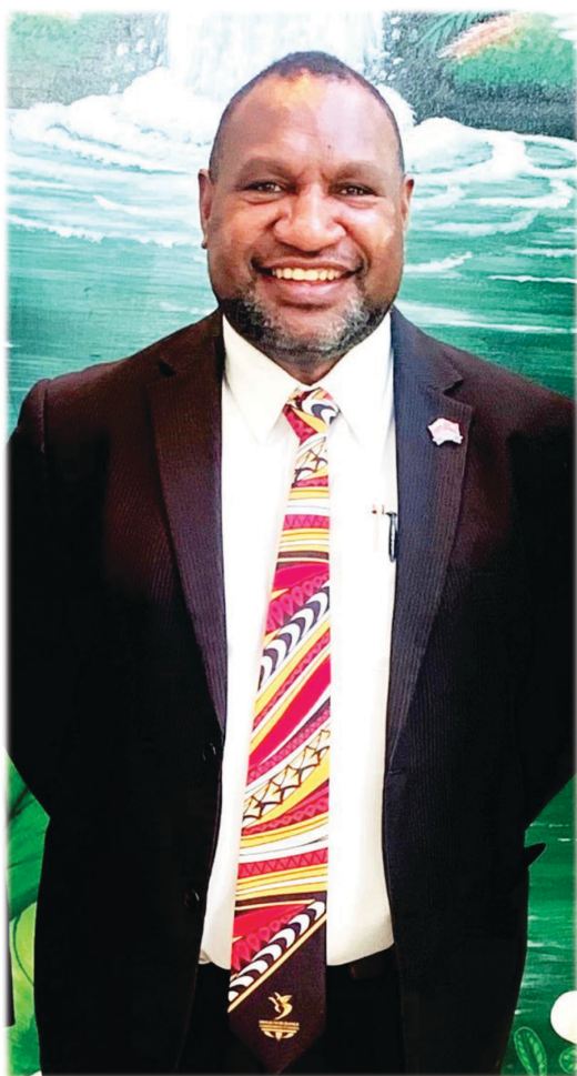
Премьер-министр Папуа – Новой Гвинеи Дж. Маране

Премьер-министр Папуа – Новой Гвинеи также отметил, что