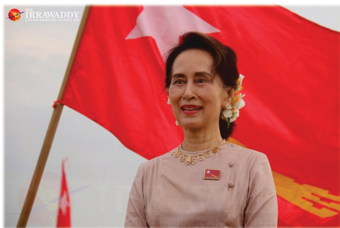
Государственный советник Аун Сан Су Чжи. Сентябрь 2020

ведения бизнеса и поощрению иностранных инвестиций 9 .