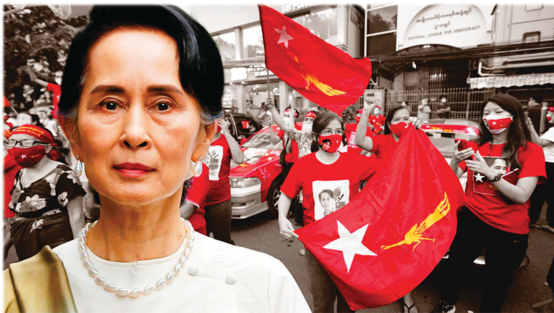
Празднование победы НЛД на улицах Янгона. Ноябрь 2020 г.

демократию (НЛД) сформирует после победы на выборах, должно приступить к работе в конце марта 2021 г. Сразу же после выборов стало ясно, что персональный состав кабинета министров будет значительно пересмотрен, так как в предыдущем составе правительства не все министры соответствовали своим должностям.