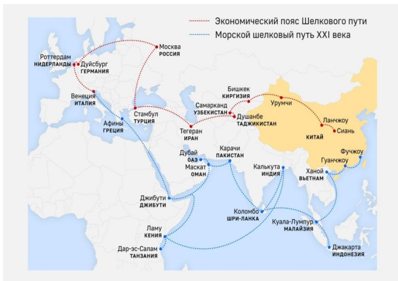
Рис.1 Инициатива «Один пояс – один путь»,