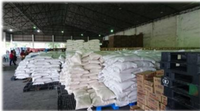
Рис. 4. Гуманитарный груз 44 .

В связи с природной катастрофой МЧС России направило Филиппинам гуманитарную помощь. «В Филиппины из порта Владивостока направлена гуманитарная помощь. На борту морского судна находится 80 тонн груза. Это продукты питания и пиломатериалы», – сообщила пресс-служба МЧС 23 декабря. В ведомстве добавили, в начале декабря Россия уже направляла Филиппинам гуманитарный груз весом 415 тонн 41 . К 24 января 2018 г. 42 все отправленные Россией гуманитарные грузы были доставлены в Манилу. Самый первый груз в 25 тонн достиг Филиппин 3-го января 43 .