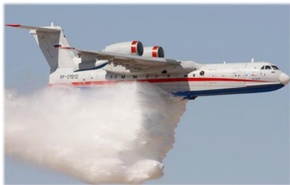
Рис. 1. Российский самолет тушит лесные пожары в Индонезии 30 .

Бе-200ЧС может планировать и за несколько секунд набрать в свои баки 12,5 тонн воды, а затем сбросить их на лесные пожары. Экипажи обучены работе в сложных условиях и имеют большой опыт борьбы с лесными пожарами. Самолеты МЧС России применялись для тушения лесных пожаров не только в России, но и за рубежом, в том числе в Сербии, Греции, Черногории и в других странах 29 .