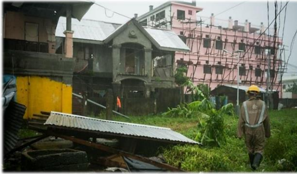
Рис. 3. Последствия тропического шторма Кай-так 40 .

Примечательно, что менее чем за неделю до этого центральные регионы Филиппин подверглись воздействию тропического шторма Кай-так, в результате которого 54 чел. погибло, а 24 пропало без вести 38 . Национальный совет по снижению риска бедствий и управлению ими также сообщил со ссылкой на Департамент социального обеспечения и развития, что 44 369 семей бежали в 608 эвакуационных центров в Биколе, Западных Висайях, Центральных Висайях, Восточных Висайях, Мимаропе и Караре 39 .