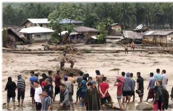
Рис. 2. Филиппинцы, пострадавшие от наводнения 37 .

22 декабря того же года на Филиппины, на о. Минданао обрушилось очередное стихийное бедствие – в результате сильного тропического циклона Тембин (на Филиппинах – Винта) произошли множественные затопления, сели и оползни. Согласно первым сообщениям, поступившим на следующий день, 23 декабря, погибло по меньшей мере 200 чел. (135 в Северном Минданао, 50 – в регионе полуострова Замбоанга и 18 – в провинции Ланао дель Сур), 100 чел. считались пропавшими 34 . По сообщениям разных источников в целом действие шторма в той или иной мере ощутило на себе свыше 270 тыс. чел. 35 , 50 тыс. 36 чел. были вынуждены покинуть свои дома.