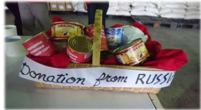
Рис. 5. Продуктовая «корзина» гуманитарной помощи 45