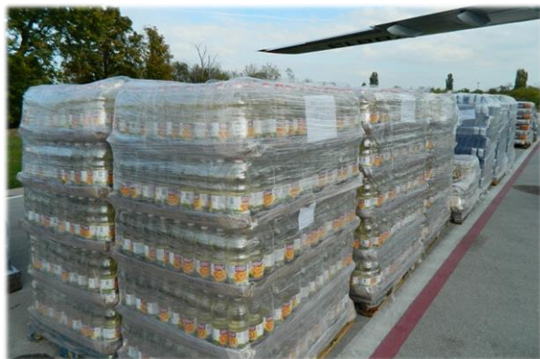
Рис. 7. Доставка гуманитарного груза 46 .