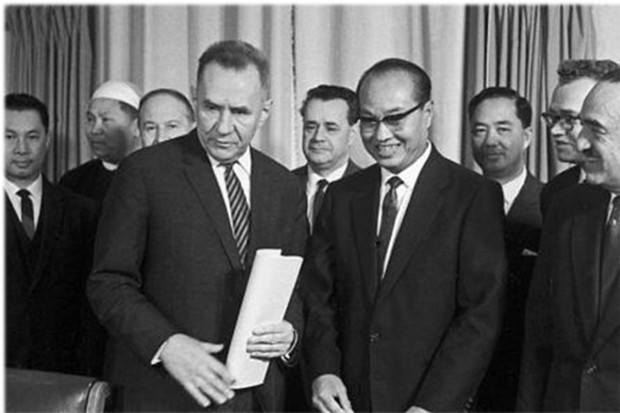
А.Н. Косыгин, Не Вин, А.И. Микоян. Москва. Сентябрь 1965 г.

явления декларации «Бирманский путь к социализму», которая была истолковала как отход от Запада, а также как нейтралитет во времена холодной войны. Но ожидаемого сближения не произошло, несмотря на объявленный генералом Не Вином курс на социалистическую ориентацию.