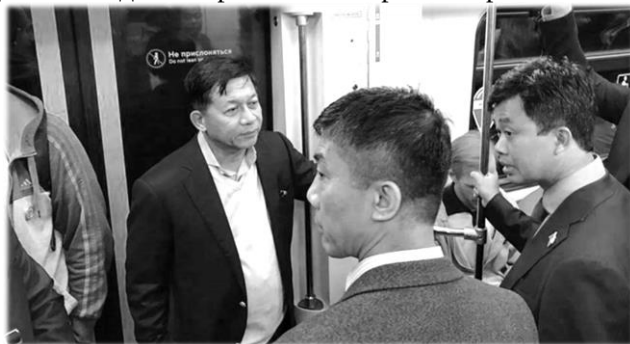
Знакомство с Москвой. Мин Аун Хлайн в метро 2017 г.

Осуждение мирового истеблишмента подтолкнуло Мин Аун Хлайна к более активному развитию отношений с Россией. В июне 2017 г. он встретился в Москве с министром обороны С. Шойгу, затем посетил Черноморский флот в Севастополе, зная, что это вызовет резкое осуждение западных стран из-за вопроса о Крыме.