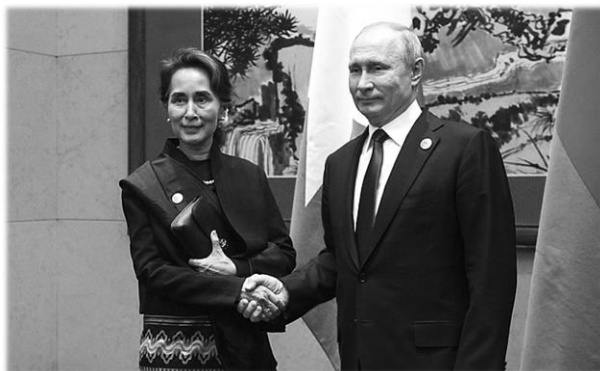
Аун Сан Су Чжи и президент РФ В.В. Путин в Пекине в апреле 2019 г.

Личная встреча государственного советника Мьянмы Аун Сан Су Чжи с президентом РФ В.В. Путиным состоялась лишь в апреле 2019 г. на полях саммита «Пояс и путь» в Пекине.