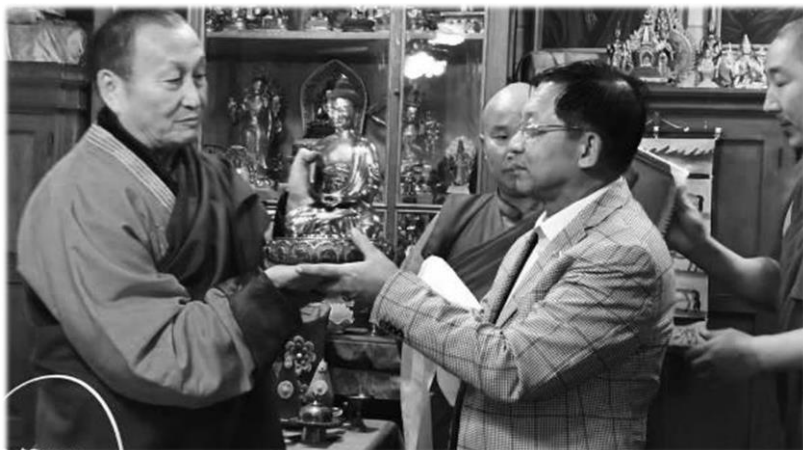
Глава буддистов России XXIV Пандито Хамбо Лама Дамба и председатель ГАС Мин Аун Хлайн в Иволгинском дацане. Бурятия. 10 сентября 2022 г.

По окончании беседы стороны обменялись памятными подарками. В музее истории хранятся подарки, подаренные буддистами Мьянмы, которые посещали Иволгинский дацан во времена Советского Союза и уже современной России по линии Азиатско-Буддийской конференции за мир 28 .