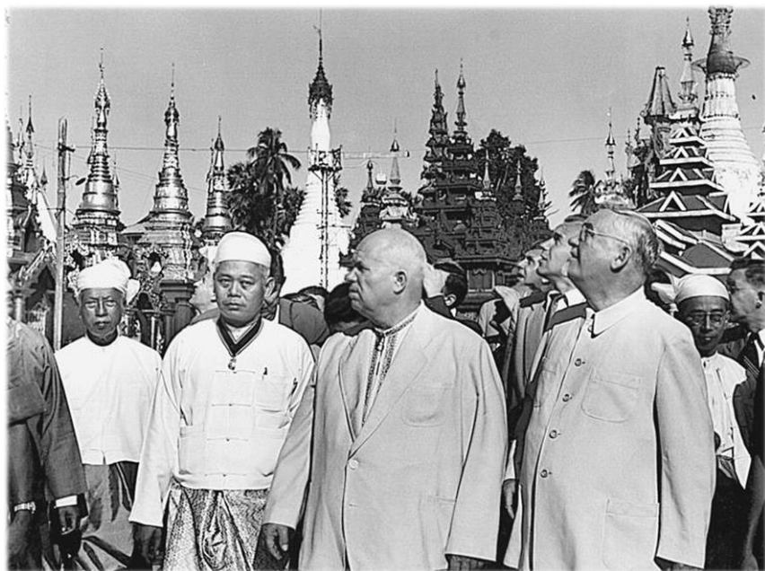
Н.С. Хрущев и Н.А. Булганин в Бирме. Рангун. Декабрь 1955 г.

В декабре 1955 г. в Бирме с ответным визитом побывала советская делегация во главе с Н.С. Хрущевым и Н.А. Булганиным. Контакты на высшем уровне стали традиционными. Н.С. Хрущев вновь посетил Бирму в феврале 1960 г., на этот раз он вел переговоры также с генералом Не Вином, занимавшем в то время пост главы временного правительства по договоренности с У Ну.