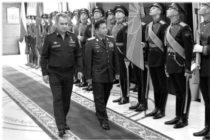
Министр обороны РФ С. Шойгу и главнокомандующий ВС Мьянмы Мин Аун Хлаин

С тех пор две страны еще более сблизились, и главнокомандующий вооруженными силами Мьянмы старший генерал Мин Аун Хлаин ежегодно стал совершать визиты в разные регионы России, посещая многие предприятия ВПК. Москва до сих пор рассматривала Нейпидо в первую очередь как военно-технического партнера, а министр обороны С. Шойгу возглавлял усилия России в качестве основного поставщика Мьянме современного оружия – вертолеты, истребители и системы противовоздушной обороны. С 2001 г. Россия также предоставляла возможность мьянманским офицерам обучаться в аспирантуре российских военных и технических вузах. К 2017 г. около 6 тыс. мьянманцев получили дипломы российских вузов, и в настоящее время их число выросло по меньшей мере до 7 тыс., некоторые аспиранты получили ученые звания.