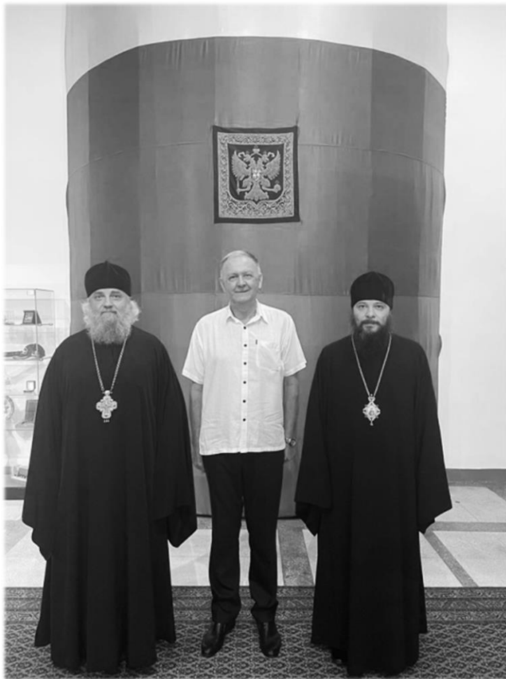
Посол РФ в Мьянме Н.А. Листопадов с членами делегации РПЦ. Янгон. 2 октября 2022 г.

обсуждены вопросы российско-мьянманского сотрудничества в религиозной сфере. Целью визита в Мьянму представителей РПЦ является проведение при содействии Посольства переговоров с мьянманскими властями относительно создания в Мьянме православного прихода и открытия храма. Это намерение имеет поддержку на высшем уровне в обеих странах 30 .