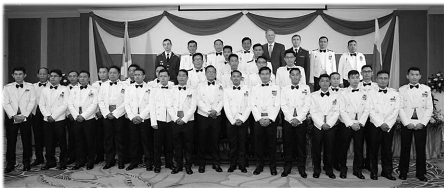
Мьянманские офицеры, окончившие российские вузы, на приеме в честь Дня защитника отечества в Янгоне (сайт посольства РФ в Мьянме).

С приходом в 2016 г. на должность нового российского посла Н.А. Листопадова – профессионального бирманиста, свободно владеющего бирманским языком, был составлен полный список всех мьянманцев, которые имели или имеют отношение к СССР/России. В этом списке есть представители старшего поколения, получивших образование еще в СССР и добившиеся успеха в самых разных сферах деятельности, и относительно молодые люди, которые после учебы в России по каким-то причинам покинули вооруженные силы и работают в госструктурах, преподают в университетах, или занялись бизнесом. С пор приглашение мьянманских офицеров на приемы по случаю Дня защитника отечества стало хорошей традицией. Молодые офицеры в форме для торжественных приемов с радостью общались и с российскими дипломатами, и с иностранными гостями, рассказывая им о своей учебе в России и о своей сегодняшней службе.