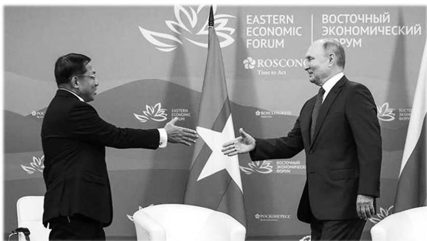
В.В. Путин и Мин Аун Хлаин. ВЭФ. Владивосток. 7 сентября 2022

долгожданной встречи с В.В. Путиным. Он назвал президента России «лидером мира», который «контролирует и организует глобальную стабильность».