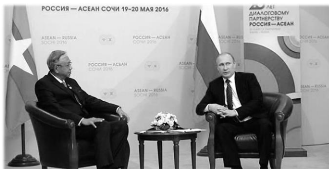
Президент Республики Союз Мьянма Тхин Чжо и президент России В.В. Путин.

сотрудничества. И мы, конечно же, очень приветствовали бы российские инвестиции в Мьянму» 12 .