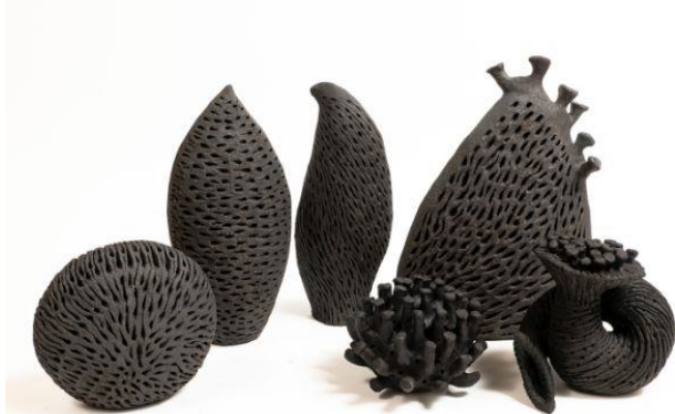
Илл. 6. Ландшафт Микроорганизмов. Хан Сай Пор, 2022 г. 6

Работы Хана выставлялись и находились в коллекциях ряда международных учреждений, общественных пространств и частных коллекций, таких как Сингапурский художественный музей, Национальный музей Китая в Пекине, Парламент Австралии, Канцелярия Постоянного представительства Сингапура при ООН в Нью-Йорке, Посольство Сингапура в Вашингтоне (округ Колумбия), Istana Singapore и Терминале 3 аэропорта Чанги.