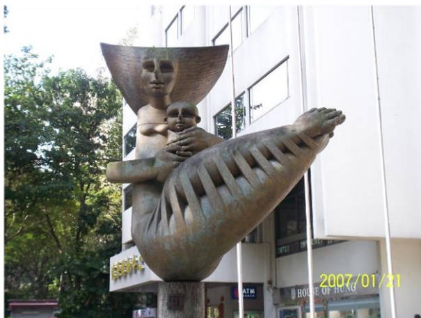
Илл. 2. Мать и дитя. Нг Энг Тенг, 1980 2 .