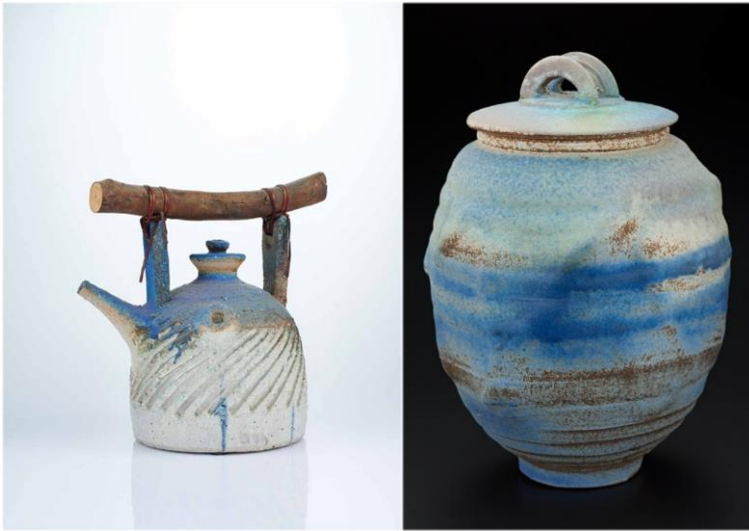
Илл. 4–5. Чайник, ваза. Искандар Джалил 5 .

многочисленные награды, и даже привели к тому, что японский император наградил его Орденом Восходящего Солнца. При этом формы его изделий достаточно традиционные (Илл. 4–5).