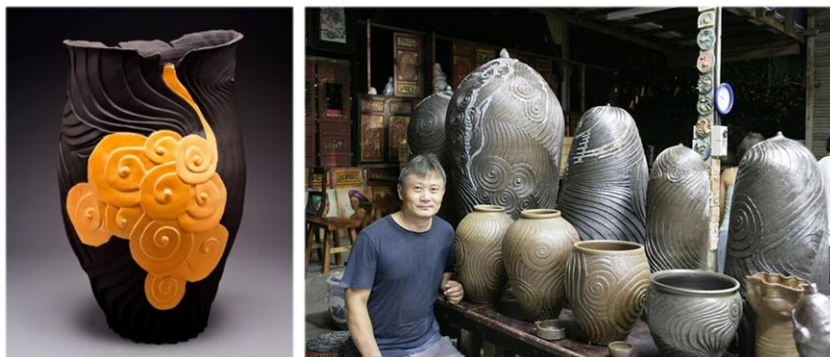
Илл. 7. (слева) Вибрация. Элвин Тан Тек Хенг, 2013 9 . Илл. 8. (справа) Элвин Тан Тек Хенг и его работы 10 .

Еще одна талантливая художница — Жанетт Адриенн Ви. Она известна своим уникальным подходом к керамике, сочетающим традиционные техники с современным дизайном. Ее работы выставлялись в различных галереях и музеях, как местных, так и международных (Илл. 9).